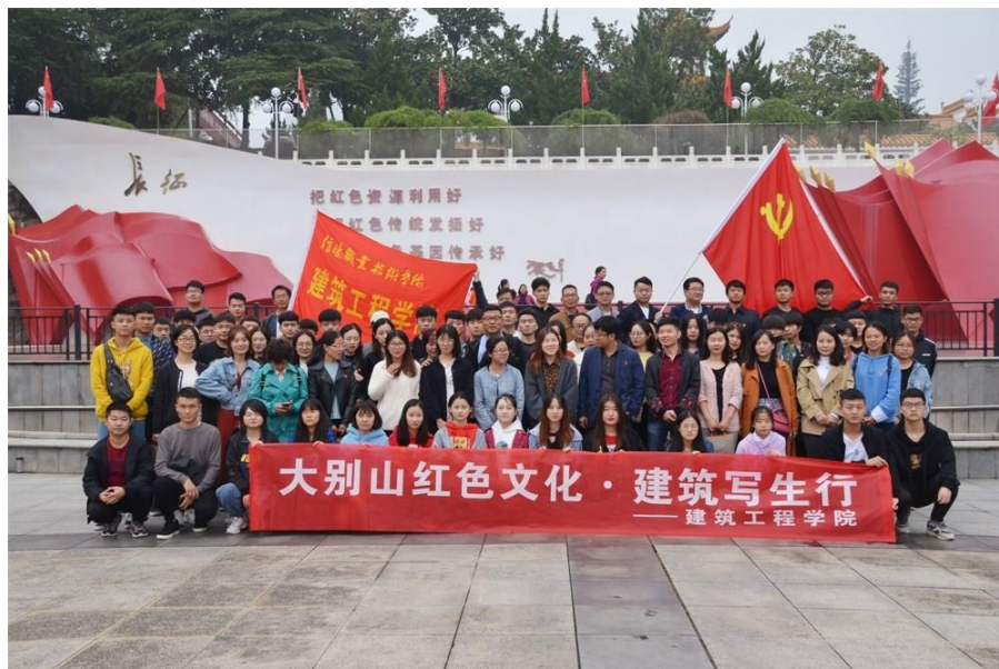
组织学生开展“大别山红色文化 建筑写生行”活动